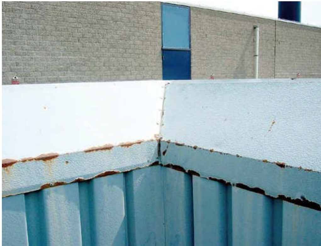
Roestvorming bij een gecoate metalen dakrand.

“Een ander belangrijk aspect met betrekking tot het waarborgen van de constructieve veiligheid is het duidelijk benoemen van verantwoordelijkheden”, stelt Kettlitz. “Er wordt in de bouwketen nog te veel ‘op elkaar afgeschoven’. De constructeur of architect schuift bijvoorbeeld de verantwoordelijkheid door naar de aannemer en die schuift het op zijn beurt weer door naar de onderaannemer. Dit speelt bij de contractvorming en tijdens de bouw zelf, maar ook bij problemen die direct na de bouw opduiken. Komt iets pas na 15 jaar aan het licht, dan is het nog complexer, want ten eerste hoeven de bij de bouw betrokken bedrijven dan niet eens meer te bestaan en ten tweede zou de gebouweigenaar ook blaam kunnen treffen omdat deze onvoldoende inspectie en onderhoud heeft uit-