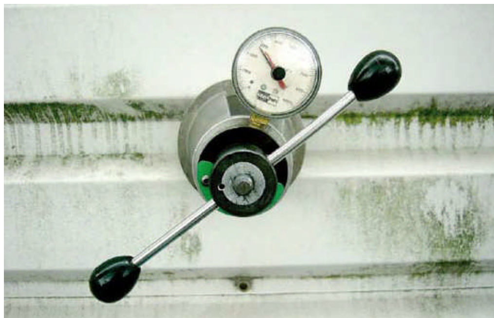
Tijdens het onderzoek is door middel van uittrekproeven de kwaliteit van meer dan 20 jaar oude bevestigers beoordeeld. De resultaten hiervan waren in het algemeen positief.

instorten of gevelplaten losraken, vloeien enerzijds voort uit onwetendheid en anderzijds uit constructieve fouten. Daarnaast nemen foutkanalen ook toe door voortschrijdende innovaties op de gebieden van productontwikkeling en vormgeving. Doordat gebouwen tegenwoordig in 3D CAD worden ontworpen, is het geen enkel probleem meer om bijzondere en complexe gevelvormen te construeren. Niets hoeft meer recht te zijn, maar dat moet wel in de praktijk gerealiseerd kunnen worden. Als daar nieuwe montagetechnieken voor ontwikkeld moeten worden, is het zaak dat je die heel goed analyseert op veiligheid en sterkte. Daar doen wij dus ook vaak de berekeningen voor. Wat ons opvalt is dat er, wellicht vanwege de crisis, tegenwoordig soms erg 'mager' wordt geconstrueerd. Men probeert de bouwsom zo laag mogelijk te houden. Maar dat mag nooit ten koste gaan van de constructieve veiligheid."