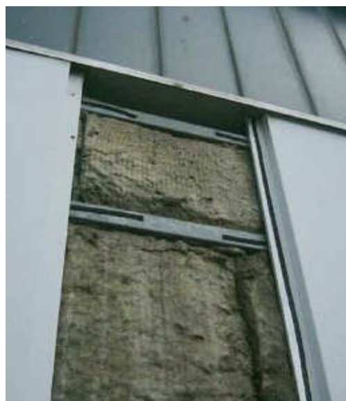
Na 25 jaar is de dragende achterconstructie, dankzij de duurzame zinklaag, nog in prima conditie.

gevoerd. Ook in de renovatiesfeer duiken soms vreemde situaties op, met als voorbeeld een dakdekker die een keurige nieuwe toplaag aanbrengt, maar waarbij vervolgens de dakconstructie in zijn geheel eraf waait omdat de onderliggende constructie met zijn bevestigingen niet goed meer bleek. Had de dakdekker, met zijn meestal toch beperkte constructieve kennis, dat moeten zien, of is dat de verantwoordelijkheid van de gebouweigenaar/beheerder? Zeg het maar. Veelal verzand je dan in een juridisch gevecht. Men zou zich in de totale branche dus meer bewust moeten worden van het feit dat men verantwoordelijk is voor datgene wat men ontwerpt, bouwt en beheert. Die verantwoordelijkheid moet men nemen en de technische kennis en/of ondersteuning hierop afstemmen in plaats van te proberen die verantwoordelijkheid middels juridische voorwaarden te minimaliseren.”